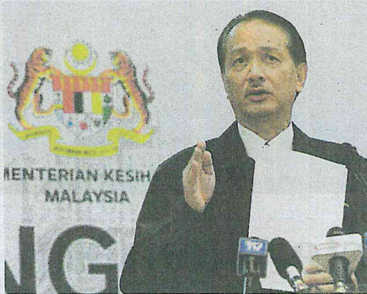
Dr Noor Hisham bercakap pada sidang media harian berkaitan jangkitan COVID-19 di Kementerian Kesihatan di Putrajaya.

ini adalah amat penting bagi mengekang dari berlakunya penularan jangkitan yang meluas dalam kalangan masyarakat.