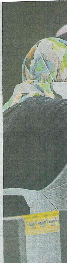
Health Ministry staff giving drinks to their colleagues, who are testing residents of Selangor Mansion and Malayan Mansion for Covid-19 in Kuala Lumpur yesterday.

tabligh gathering. The man was admitted to Kuala Lumpur Hospital on March 22, and died on April 8 at 9.30am."