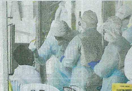
PETUGAS KKM mengambil sampel salah seorang penghuni Selangor Mansion.