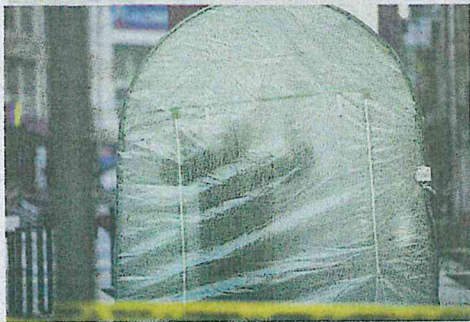
BILIK semburan sanitasi yang disediakan di sekitar Selangor Mansion dan Malayan Mansion untuk anggota Polis Diraja Malaysia (PDRM) selepas mereka melakukan rondaan.