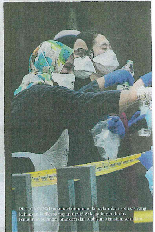
PETUGAS KKM memberi minuman kepada rakan setugas yang kehausan ketika Saringan Covid19 kepada penduduk bangunan Selangor Mansion dan Malayan Mansion, semalam.

Pada 31 Mac lalu, kerajaan menguatkuasakan PKPD di Menara City One, Jalan Munshi Abdullah, Kuala Lumpur yang berkuat kuasa sehingga 13 April depan.