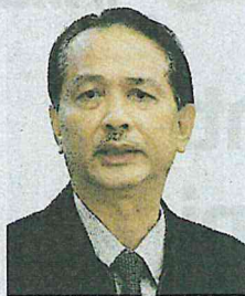
DR NOOR HISHAM

Beliau berkata, sehingga semalam, terdapat 27 kes positif coronavirus (Covid-19) dikesan di kawasan tersebut