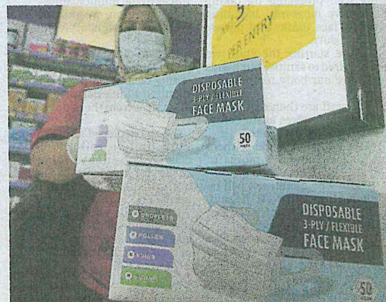
A woman buying face masks in a pharmacy in Kuala Lumpur yesterday.

"Five per cent of patients are in stage five. They suffer from shortness of breath and need breathing aid."