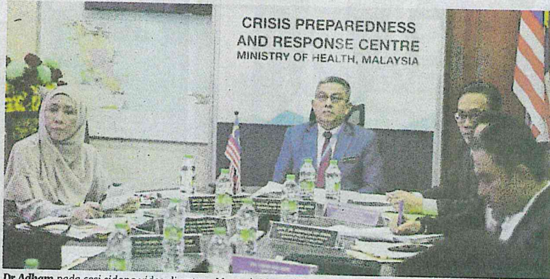
Dr Adham pada sesi sidang video di antara Menteri-Menteri Kesihatan ASEAN, semalam.