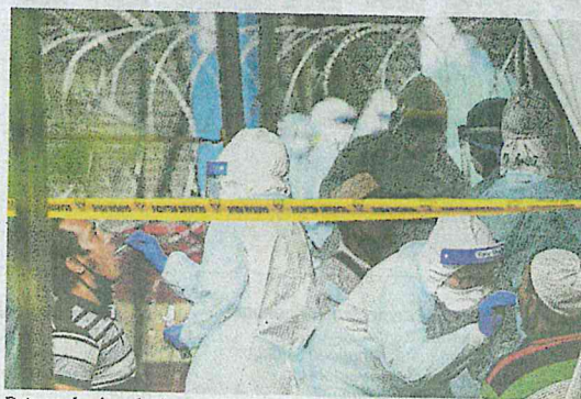
Petugas barisan hadapan KKM melakukan pemeriksaan ujian saringan kepada penghuni flat Selangor Mansion, kelmarin.

Dua kematian lagi dicatatkan semalam, menjadikan keseluruhan kematian kini 65, manakala 76 pesakit kini berada dalam Unit Rawatan Rapi (ICU) dengan 45 kes memerlukan bantuan pernafasan.