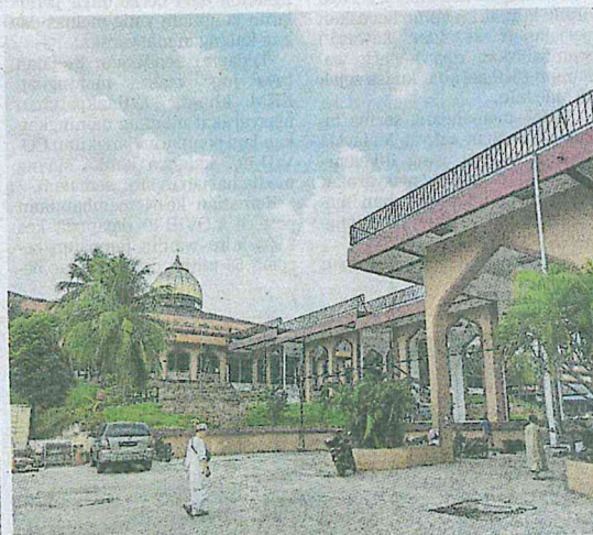
Antara jemaah tabligh Masjid Seri Petaling yang menjalani saringan COVID-19 pada 5 April lalu.

27 dikesan positif COVID-19 termasuk dua mangsa di ICU