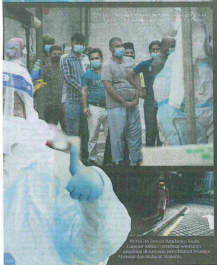
PEMBUJUN Selangor, Mansion Berbaris, menunggu giliran untuk menerima wang sumbangan covid-19, semalam.

• Kes kematian ke-65 (kes ke-1,906), lelaki warganegara Pakistan berumur 69 tahun dan mempunyai latar belakang penyakit kencing manis. Mempunyai sejarah menghadiri perhimpunan di Seri Petaling. Dirawat di Hospital Kuala Lumpur pada 22 Mac dan disahkan meninggal dunia 8 April 2020, jam 9.30 pagi.