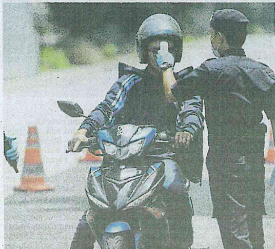
Anggota polis memeriksa suhu badan pengguna jalan raya bagi mencegah penularan wabak Covid-19 sepanjang Perintah Kawalan Pergerakan di sekitar Kuala Lumpur.

"Dukacita dimaklumkan, pertambahan dua kes kematian berkaitan COVID-19, sekali gus jumlah korban kini 65 orang atau 1.58 peratus," katanya.