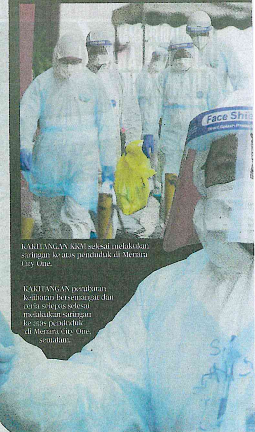
KAKTANGAN KKM selesai melakukan saringan ke atas penduduk di Menara City One.